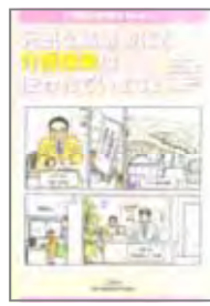
(各シリーズ4頁オールカラー)